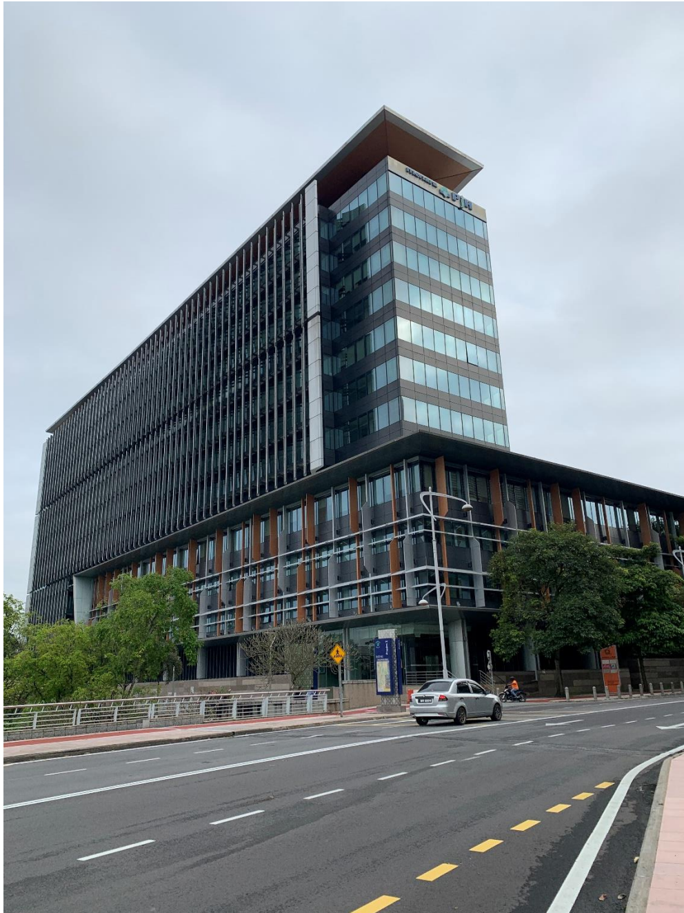
Pejabat Lembaga Ahli Geologi, di Aras 8, Menara PjH, Putrajaya.